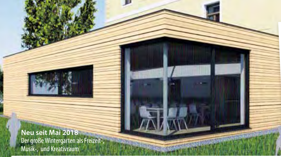
Neu seit Mai 2018 Der große Wintergarten als Freizeit-, Musik-, und Kreativraum