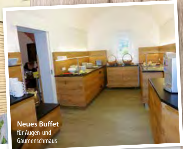
Neues Buffet für Augen- und Gaumenschmaus