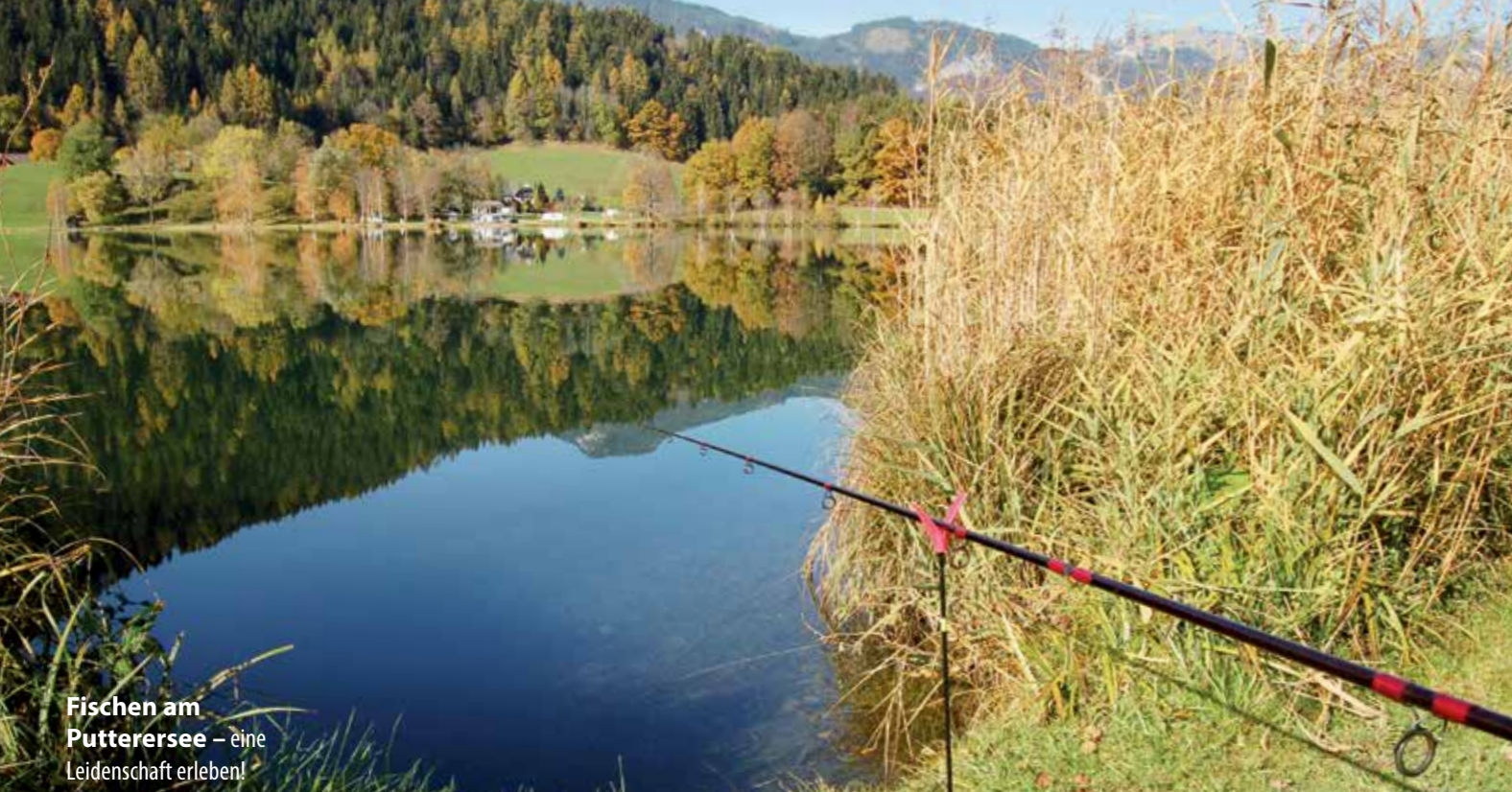
Fischen am Putterersee – eine Leidenschaft erleben!